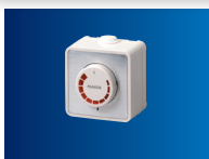
Drehzahlsteller ST 1